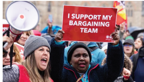
Striking members of the Public Service Alliance of Canada protest on Parliament Hill, in Ottawa, on Wednesday.

cbc.ca/news/canada/ottawa/psac-strike-fined-hot-dogs-1.6824718